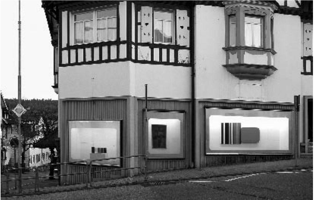
Heimo Zobernig, four paintings installed in Raum 20, Süßes Eck, Gerwigstraße 1, 2007.