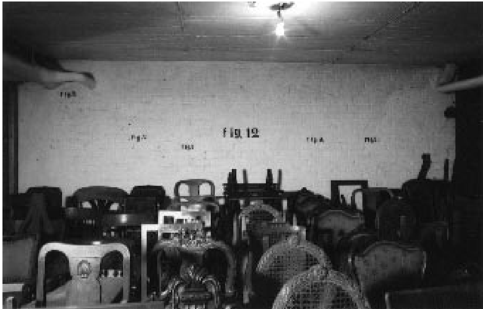
Tacita Dean: Section Cinéma, 16mm-colorfilm, optical sound, 13 min., Loop. Produced for the exhibition 12.10.02 – 21.12.02 at Kunstverein für die Rheinlande und Westfalen, Düsseldorf 2002. The filmstill shows Broodthaers' former studio in the basement at Burgplatz 12 in 2002 with temporarily stored chairs from a furniture dealer.

Section XIXe siècle / Rue de la Pépinière, Brussels, 09/27/1968 – 09/27/1969